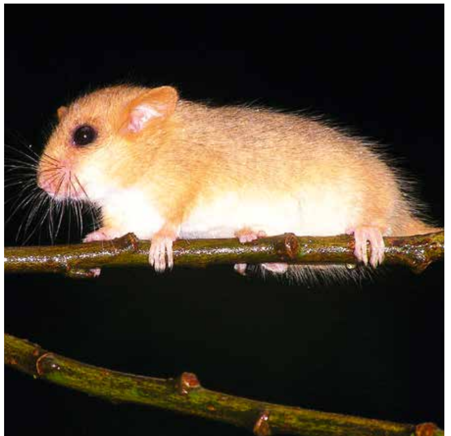
Le muscardin pourrait profiter de l'extinction de l'éclairage public à Val-de-Ruz pour étendre son territoire et, qui sait, augmenter sa population. (Paul Marchesi)

D'ici l'année prochaine, le Val-de-Ruz devrait être plongé dans le noir entre minuit et 4h45, à l'exception des passages pour piétons. En attendant, la région est coupée en deux par son éclairage public. Cette lumière qui fait office de barrière empêche certaines espèces de rejoindre le cœur de la vallée. /cwi