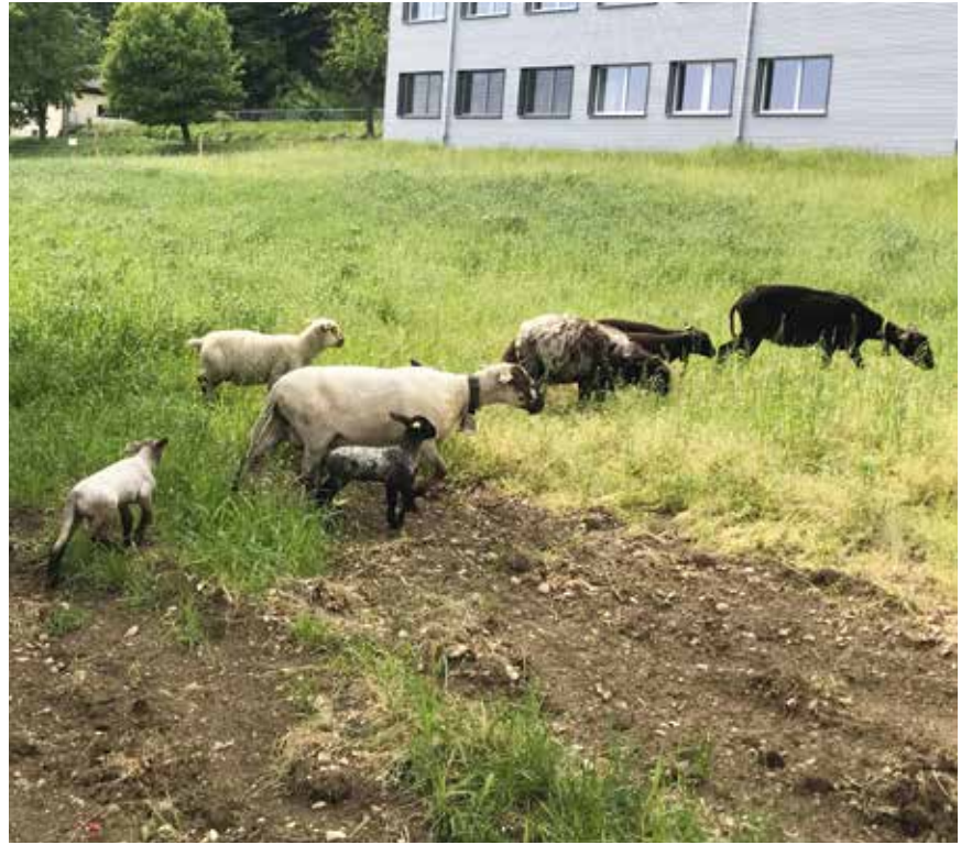
Les moutons avaient déjà été préférés à la tondeuse le printemps dernier au collège de La Fontenelle.

La Commune et le Parc Chasseral demandent expressément de ne pas nourrir les ovins. Ils trouveront tout ce qui leur est nécessaire par eux-mêmes. /comm-cwi