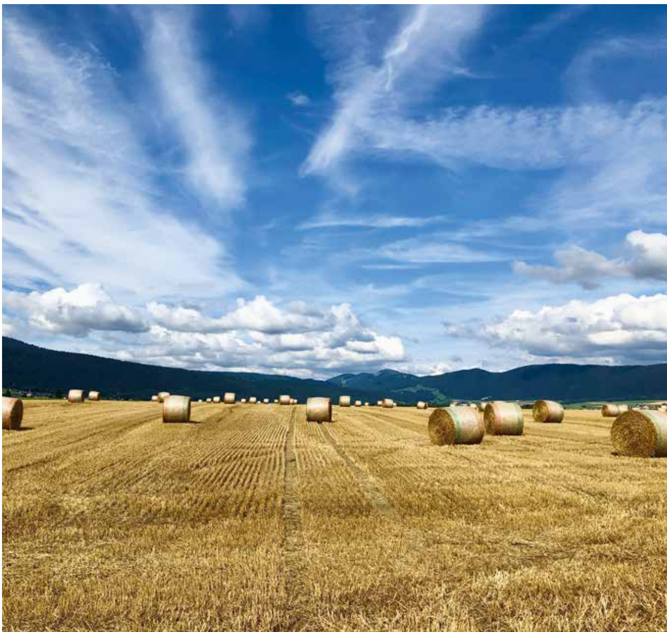
Val-de-Ruz, terre de blé